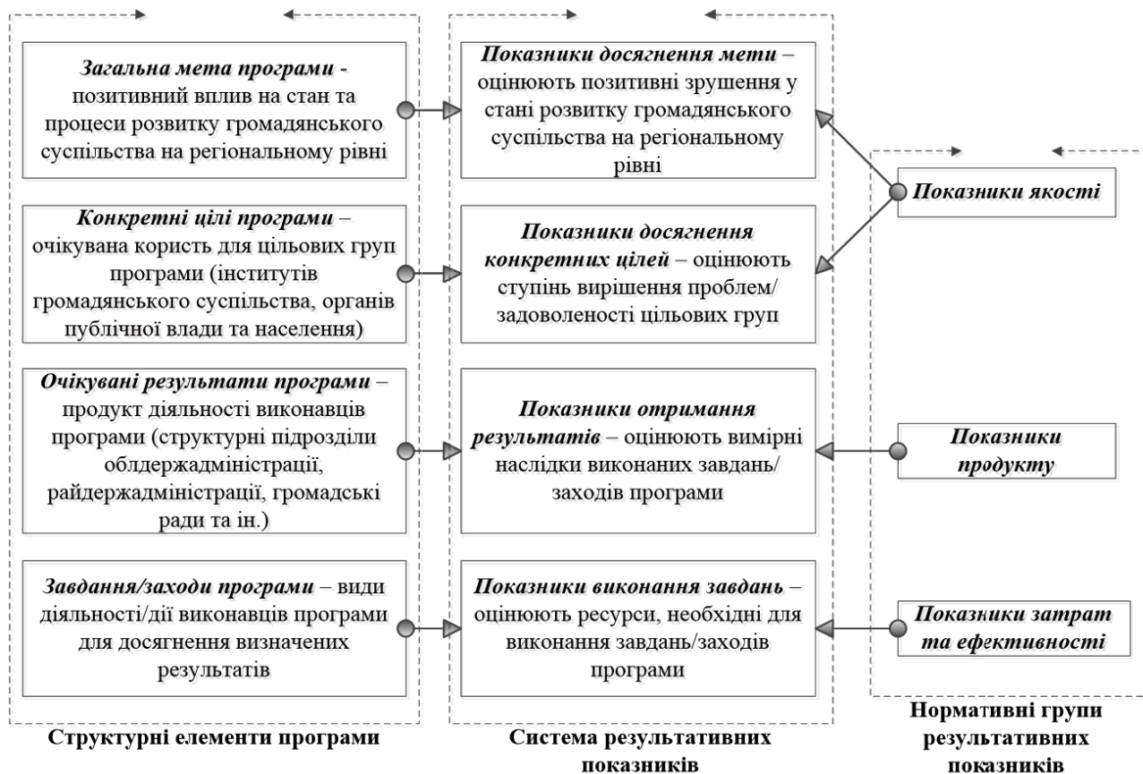
Рисунок 2. Узгодженість структурних елементів програми та нормативних груп результативних показників