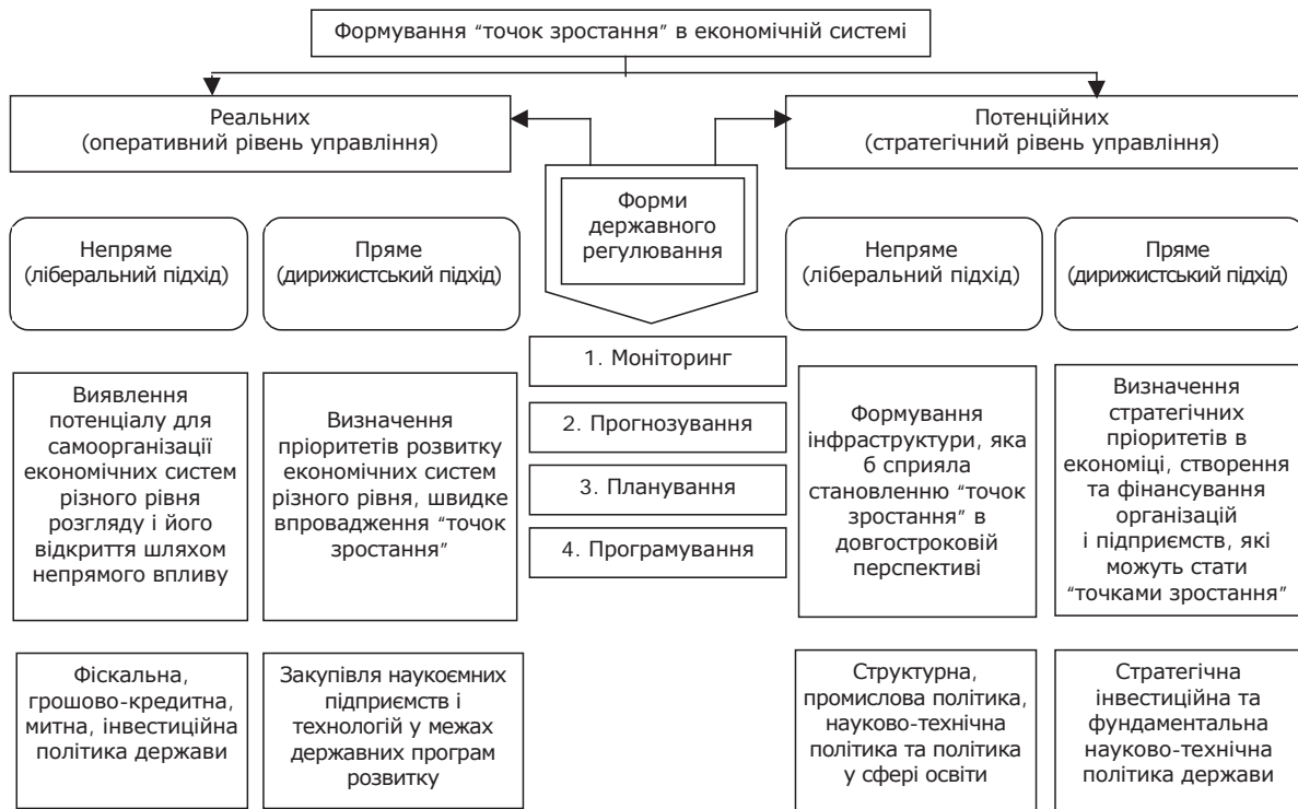
Рис. 3. Варіанти алгоритму формування "точок зростання" в економіці

Регіональний аспект дає змогу виділити регіони, у яких розвинені високотехнологічні галузі промисловості: Київська, Харківська та Львівська області України. Для решти регіонів доцільне впровадження моделей формування "точок зростання", реалізоване переважно дирижистським способом у промислових регіонах країни, і інфраструктурним – у сільськогосподарських.