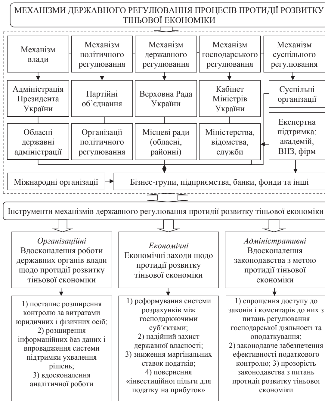
Рис. 2. Концептуалізація структурно-логічної моделі комплексного механізму державного регулювання процесів протидії розвитку тіньової економіки