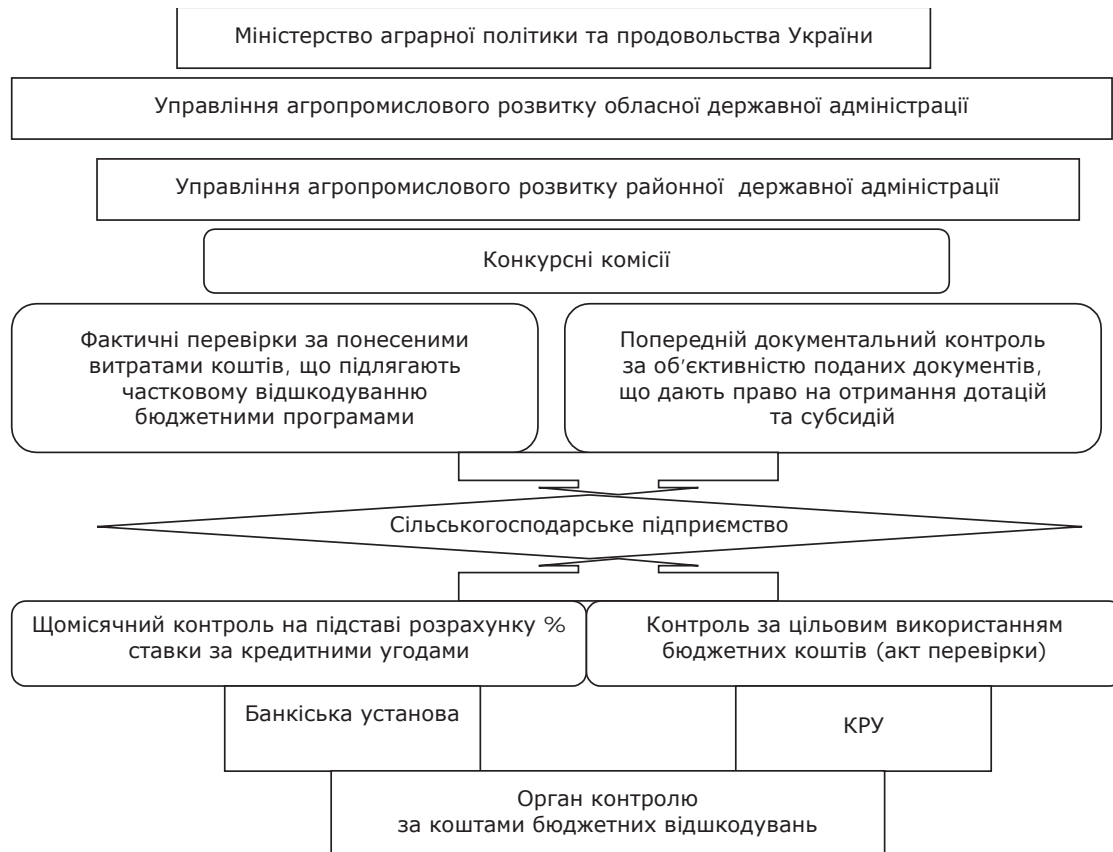
Рис. 1. Модель механізму контролю за наданням сільськогосподарським товаровиробникам бюджетної підтримки та її цільовим використанням (розроблено автором)

редній документальний контроль за об'єктивністю наданих документів і фактичними перевірками (з виїздом на об'єкти, що підпадають під бюджетні цільові програми), що дають право на отримання державних дотацій та субсидій [85]. Механізм контролю за наданням сільськогосподарським підприємствам бюджетної підтримки та її цільовим використанням наведено на рис. 1.