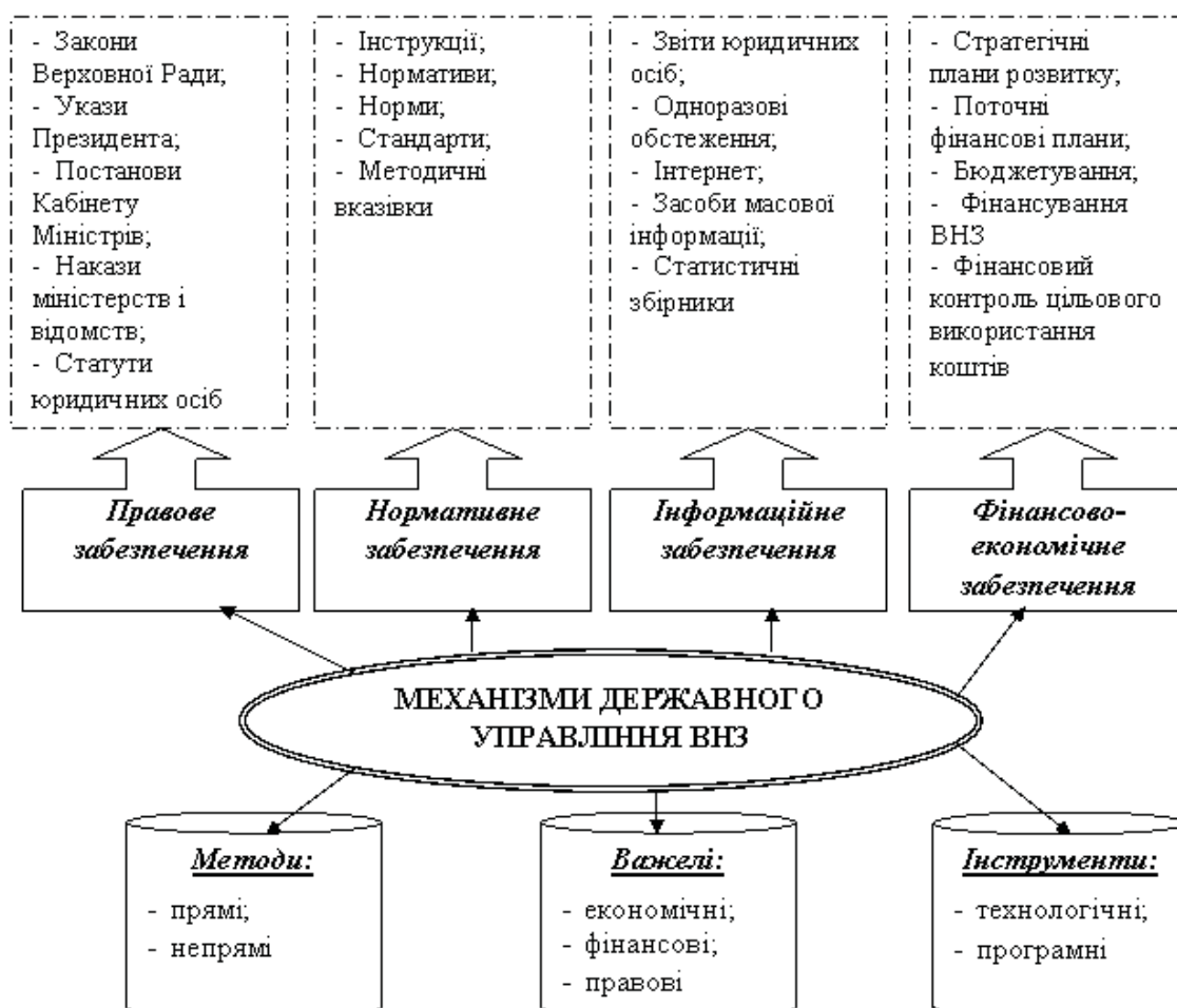
Рис. 2. Структура механізму державного управління ВНЗ

Крім того, як засвідчили результати ревізій, відсутність окремих нормативних актів та/або їх неузгодженість з іншими актами законодавства призводить до не-