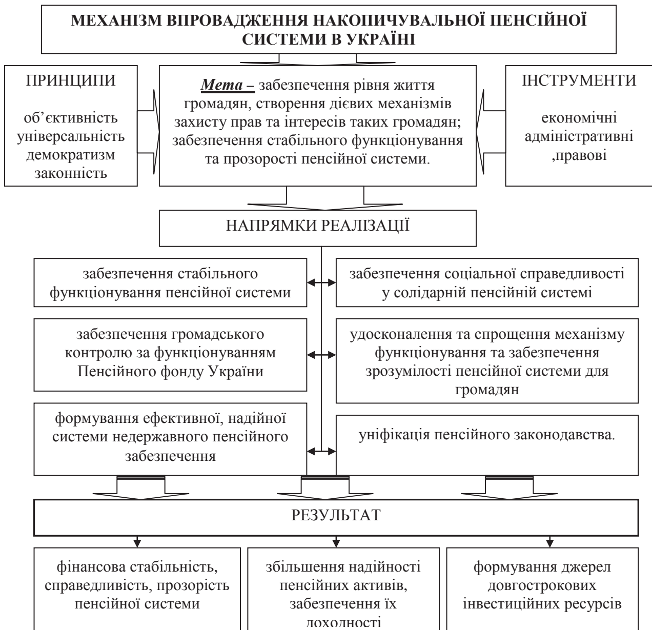
Рис. 2. Державний механізм впровадження накопичувальної пенсійної системи в Україні

Відповідно до Стратегії сталого розвитку «Україна – 2020», Стратегії модернізації та розвитку Пенсійного фонду України на період до 2020 року визначено державний